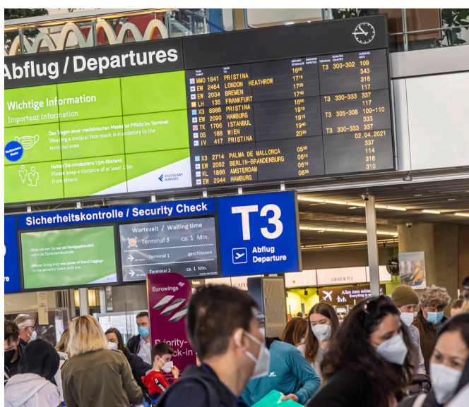
Die Zahl der Flugbuchungen steigt enorm: Die Lufthansa geht zum Beispiel davon aus, dass im August 55 Prozent des Vorkrisenniveaus erreicht werden.

Die verschiedenen Blickwinkel der Fondsmanager zeigen: Mobilität hat in einer global vernetzten Welt viele Facetten, an denen Anlegerinnen und Anleger teilhaben können.