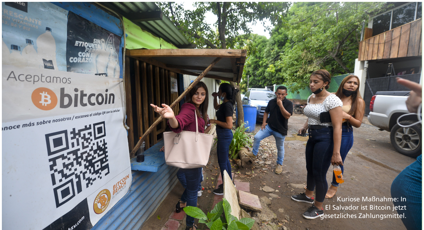
Kuriose Maßnahme: In El Salvador ist Bitcoin jetzt gesetzliches Zahlungsmittel.