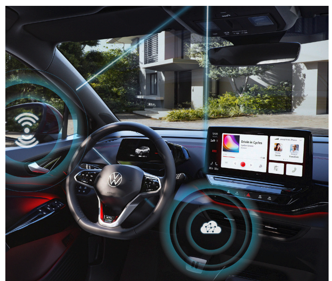
Computer auf Rädern: Mehr als 90 Prozent der Innovationen im Automobilsektor kommen aus dem Bereich Softwareentwicklung.