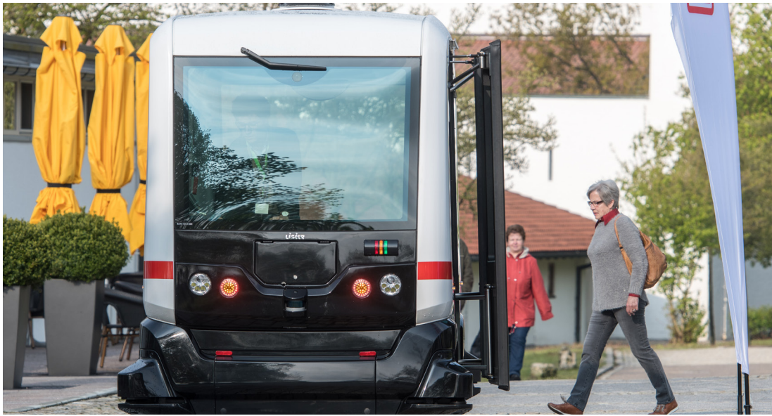
Ohne Fahrer ans Ziel: In Niederbayern testet die Deutsche Bahn in einem Pilotprojekt das autonome Busfahren. Gerade ältere Menschen im ländlichen Raum kann dieses Konzept deutlich mobiler machen.

der Apple-Handys sogar bald eigene Autos her. Auch Amazon hat mehr als eine Milliarde US-Dollar in das Elektro-Start-up Rivian investiert – und selbst mehr als 100.000 Transporter der neuen Marke bestellt. Der Lockruf von Milliarden mobiler Menschen zieht die Tech-Konzerne an.