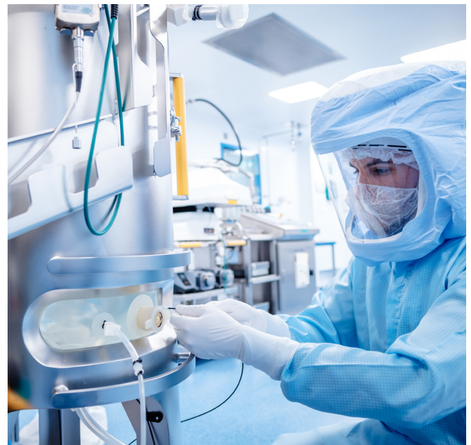
Impfstoffherstellung bei Biontech in Marburg: Das deutsche Unternehmen produziert 2021 allein in diesem Werk 750 Millionen Impfdosen.

Getrieben wird der Aufschwung zusätzlich von den zusammen mehrere Billionen Euro schweren Klimaschutzprogrammen, die die EU, die USA und weitere Nationen aufgelegt haben, um die Kohlendioxid-Emissionen bis 2050 gegen null zu drücken. „Hier geht es um weit mehr als nur die Umstellung von Verbrennungsmotoren zu Elektroantrieben in der Automobilindustrie“,