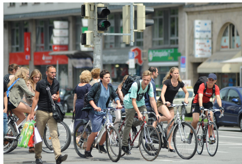
Stahlross statt Auto: In Bayern werden bis 2024 für 200 Millionen Euro neue Radwege gebaut. Insbesondere München gewährt Rädern größeren Vorrang.

Gerade diese Bauteile stehen jetzt im Fokus: Der batterieelektrische Antrieb und elektronische Helfer bei Komfort und Sicherheit machen Firmen zu Motoren der Mobilität, die bisher eher bei Computern, Mobilfunk oder Unterhaltungselektronik ihren Schwerpunkt hatten. In jedem Elektroauto sind schon heute Chips für mehr als 600 Euro verbaut. Hersteller wie Infineon oder ASML produzieren inzwischen im Takt der Autokonjunktur. Einige dieser Firmen sind sogar direkt in den wichtigsten Bereich der individuellen Mobilität investiert: den Fahrzeugbau. Der chinesische Konzern Foxconn etwa hat sich unlängst mit Stellantis, dem Zusammenschluss von PSA und Fiat-Chrysler, verbündet. Und mit den E-Autoherstellern Byton und Fisker stellt der Produzent